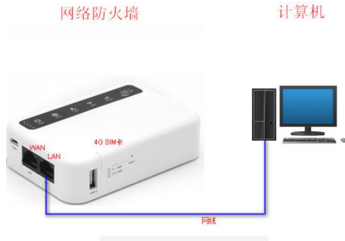
使用 SIM 卡上网

SMSAlarm FireWall 3.0 是一款提供上网功能的网络防火墙，仅打开特定的端口(邮件/微信相关端口)来访问外部网络，从而为计算机系统屏蔽掉不必要的端口开放风险。SMSAlarm FireWall 3.0 可以选择使用 SIM 卡连接外网或者通过连接到一个能上网的路由器来上网，如下图