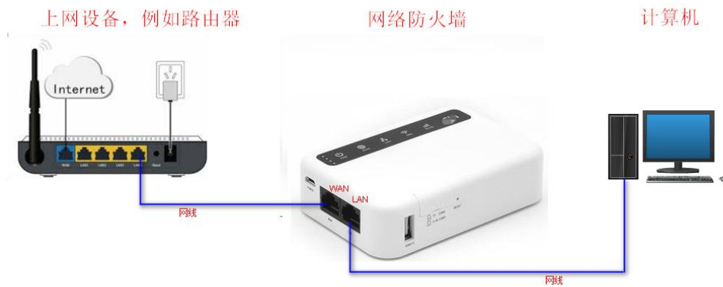
在 WAN 口连接网线上网